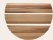
Le couvercle bois