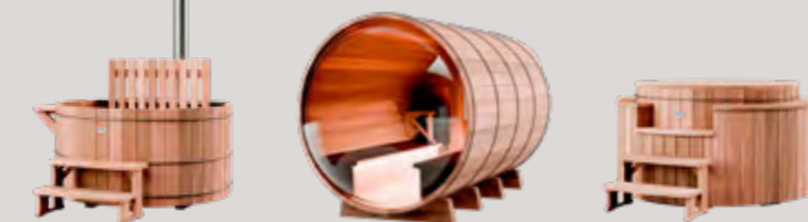
BAINS NORDIQUES, SAUNAS, SPAS EN BOIS