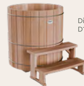
Dimensions : D120 x H120 cm

Après une ou plusieurs séances de sauna, plongez dans le petit bain froid Storvatt pour refroidir votre corps. L'immersion dans une eau froide à la sortie d'un sauna aide à la vasoconstriction des pores de la peau préalablement dilatés par la chaleur.