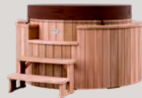
Spa avec couvercle isotherme