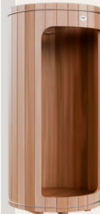
Dimensions : 2,4m H x 1,2m L

• Les cerclages en barres inox cintrées permettent un serrage optimum de l'assemblage. Un système de coupleurs également en inox assure le réglage de la tension. La robustesse des cerclages permet de donner une garantie illimitée contre le gel. Le fond bois massif est usiné avec une précision inégalée assurant un écoulement parfait de l'eau vers son centre.