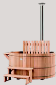
Fourneau à bois