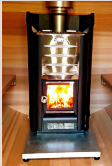
Fourneau à bois en option