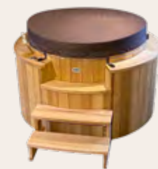
Le couvercle isotherme pour spa ou bain nordique

Que vous souhaitiez agrémenter ou personnaliser votre bain nordique, spa ou sauna, Storvatt offre une panoplie très complète d'accessoires.