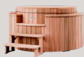
Spa avec couvercle bois en option

Nos spas sont proposés avec un couvercle isotherme. En option, vous pouvez opter pour un couvercle bois.